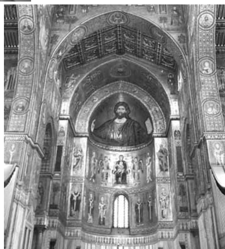
Іл. 5. Мозаїка в апсиді храму Різдва Пресвятої Богородиці. Бл. 1184–1194 рр. Монреале

чого, грандіозного зображення божественної особи у вівтарях соборів переважно базилікального плану. Але, на відміну від Києва, чільне місце на вівтарних апсидах соборів Монреале, Палермо, Чефалу (іл. 5) посідала масивна напівпостать Христа. У деяких соборах (Торчелло, Мурано) апсиду прикрашала постать Богородиці у повний зріст як Одигітрії чи Ассунти.