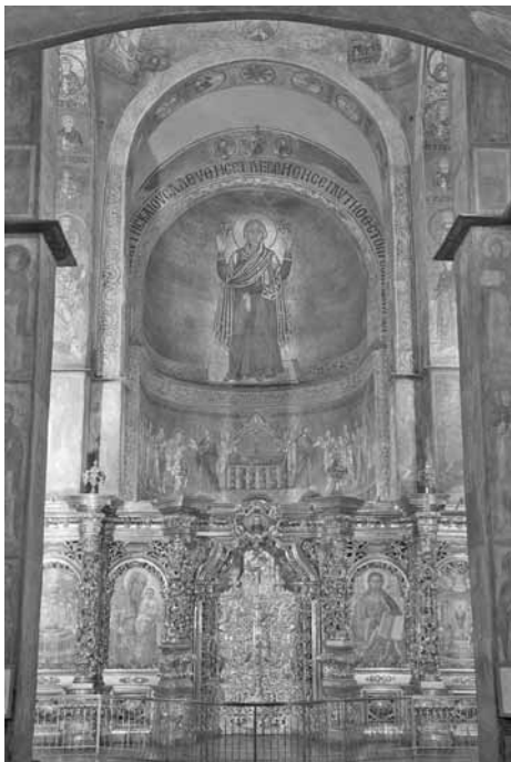
Гл. 1. Видгляд на апсиду з Богоматір'ю Орантою. Мозаїка. Бл. 1018 р. Храм Св. Софії. Київ

щення”. Сирійський диякон Павло Алеппський, який бачив інтер'єри Софійського, Печерського та Михайлівського храмів ще у їхньому первісному вигляді, докладно описав саме таку схему [11, 137, 166, 172].