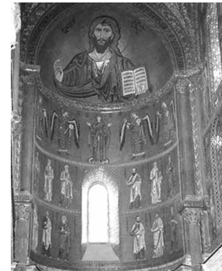
Іл. 6. Мозаїка вівтаря храму Преображення Господнього. 1145 р. Чефалу

Нікопейської з апсиди церков Св. Софії в Охридї та ікони Божої Матері Знамення (поясної) з апсиди храму Св. Пантелеймона (Нерезі). Ці зображення є зразками втілення масивності, грандіозності фрескового образу