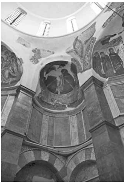
Іл. 3. Вигляд на бокові компартменти у храмі Неа Моні. Бл. 1060 р.

названих храмів замість образу Оранти присутня Богоматір на троні. Причину нетривалого використання образу Оранти у післяіконоборчій період спробував дослідити австрійський вчений Отто Демус. Він акцентував на тому, що тип Богородиці на троні викликав посилену критику іконоборців за надмірний ієратизм. Тож з перемогою іконовшанування, на короткий час актуальним стає образ Марії Оранти. Та коли з X ст. стихли всі дискусії, творці програм і митці знову стали зображувати в апсиді вівтаря Богоматір на троні. Постать Оранти “відіслали у далеку провінцію” і,