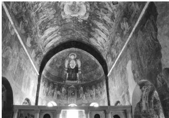
Іл. 8. Видяг на апсиду з Богоматір'ю Нікопеєю. Фреска. Бл. 1040 р. Храм Св. Софії. Охрид

Божої Матері, яке мало місце у сакральній традиції Македонії (іл. 8). Звернемо увагу, що у структурі згаданих македонських храмів образ Божої Матері посідає таке ж місце, як образ Оранти у храмах Києва.