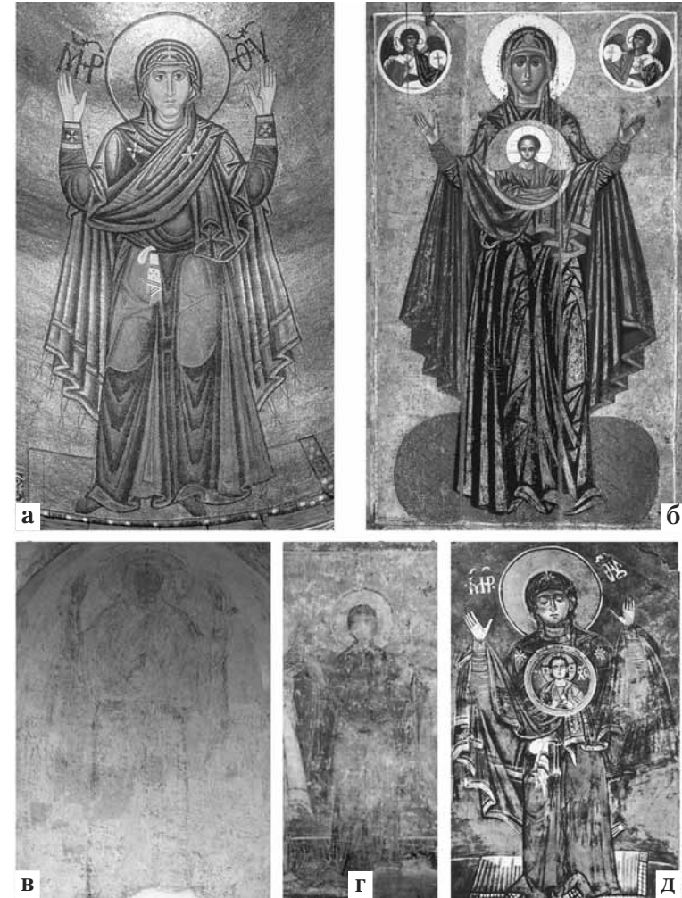
Іл. 10. Образ Оранти у храмах Київської Русі:

Одинока велична постать Богородиці зображена на золотому тлі апсиди (іл. 9). Вона одягнена в золотисто-пурпуровий мафорій та в синю столу, інтенсивну за колористичним звучанням. Цей синій колір вдало перекидається на одяг Христа, який двічі зображений у сцені Євхаристії. Роль даної композиції, що розташовувалася під Богоматір'ю, була важлива не тільки догматично, але й формально. В апсиді давньоруського храму Євхаристія не лише репрезентує ідею причастя у вічності, але