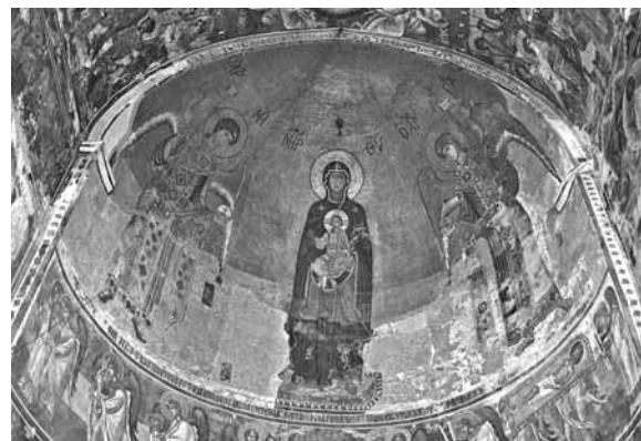
Іл. 7. Богоматір Нікопея з архангелами. Фреска конхи апсиди. 1125 р. Храм Вмч. Георгія. Гелаті

У Македонії в апсидах декількох соборів (Охрид, Нерезі, Курбіново) Богоматір представлена у типі Знамення, Нікопей та Одигітрії, яка сидить. Але найцікавішими для нашого дослідження є постаті Богоматері