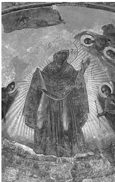
Іл. 11. Богоматір Оранта з ангелами. Фреска конхи апсиди храму Св. Кирила. XII ст. (поновлена у XIX ст.). Київ.

Однією з найпримітніших характеристик Софійської Оранти є жест її широко розведених рук у масштабі 1:2 до цілої постаті. Богородиця тримає розведені в сторони руки, а їхня вертикальна ритміка має значення пропорційного орієнтира (іл. 1). Так, ширина рук Діви Марії дорівнює висоті ківорія з престолом і дорівнює відстані між обома постатями Христа у сцені Євхаристії. Вертикальна міць постави Софійської Оранти підсилюється спадаючими складками її мафорія. Такий принцип зображення (широко спадаючі складки мафорія) зауважується у всіх без винятку зображеннях Богоматері в типі Оранти чи Знамення – від фрескових постатей Оранти з Кирилівського,