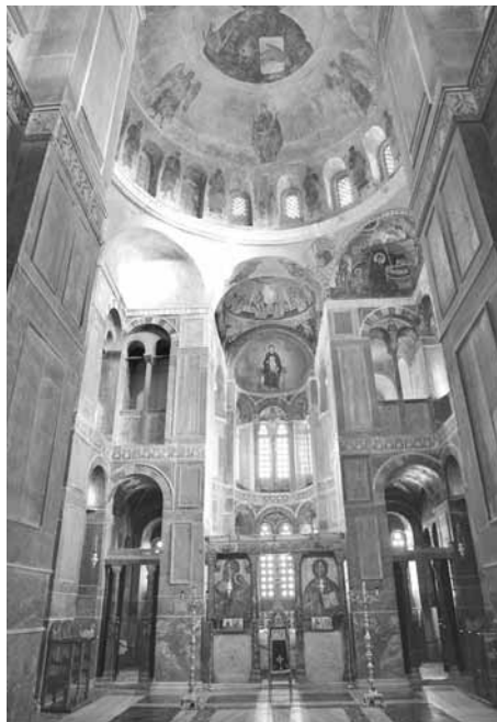
Іл. 4. Загальний вигляд інтер'єру храму Хосіос Лукас. 1065–1067 рр. Фокід

чого, грандіозного зображення божественної особи у вівтарях соборів переважно базилікального плану. Але, на відміну від Києва, чільне місце на вівтарних апсидах соборів Монреале, Палермо, Чефалу (іл. 5) посідала масивна напівпостать Христа. У деяких соборах (Торчелло, Мурано) апсиду прикрашала постать Богородиці у повний зріст як Одигітрії чи Ассунти.