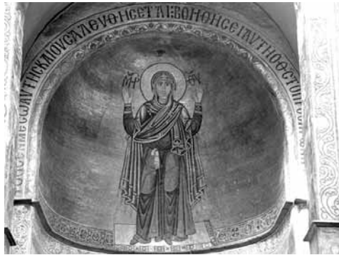
Іл. 9. Богоматір Оранта. Мозаїка апсиди. Бл 1018 р. Храм Св. Софії. Київ

• світлова система при домінуванні золота: активне застосування золотих асистів (переважно мафорій Діви Марії), золоте сяйво навколо постаті Оранти (для мозаїчних комплексів). Поєднання золотого і білого кольорів (ікона Великої Панагії). Колористичний контраст і акцент (фреска);